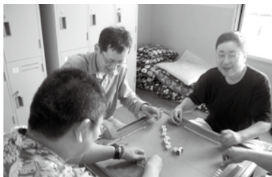
次の一手は どうくるか?

「火・金曜日に仲間が集まり麻雀。ゲームに夢中。」(K)「リーチ、リーチ。あー、参ったな!」といった掛け声とともに盛り上がります。(O)「頭の体操になって良いよ、面白いよ!」(M)「2~3時間があっという間に経過します」(D)