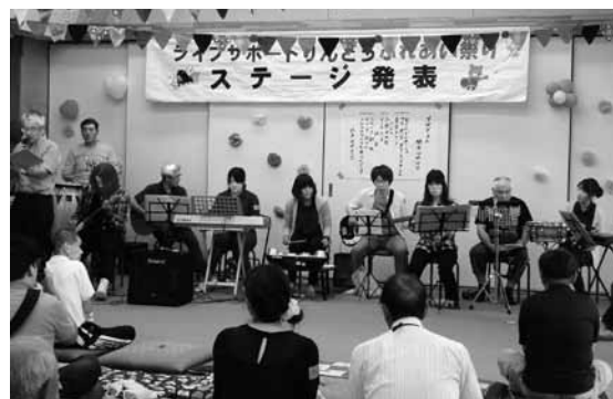
大いに盛り上がりました!

遠方からお越しいただいた方、家族で楽しんでくださった方々、毎年楽しみにしている方、心より感謝申し上げます。また、おまつりに際してご協力くださった多くの皆様に感謝申し上げます。ありがとうございました。(萩原)