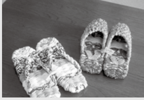
ぞうり・スリッパ