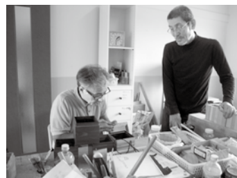
次は何を 作ろうかな?