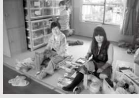
楽しく作っています