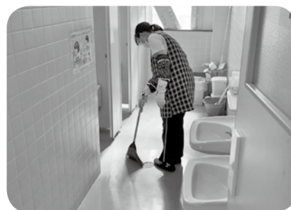
夏場は虫との戦いです