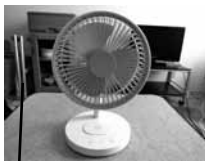
お気に入りの扇風機 ミニサイズだけど風が強く音が小さい！ 充電式なので持ち運びができて便利です

生活がガラリと変わりました。平日に通院や就労、ヘルパー等の支援が入るので平日は予定で埋まっています。体調が安定しないことが不安ではありますが、支援を受けながら頑張りたいです。