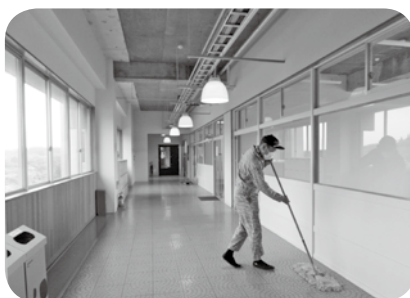
長～い廊下のモップがけ