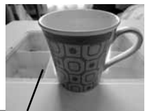
愛用中のマグカップ♡ お気に入りですよ使っています