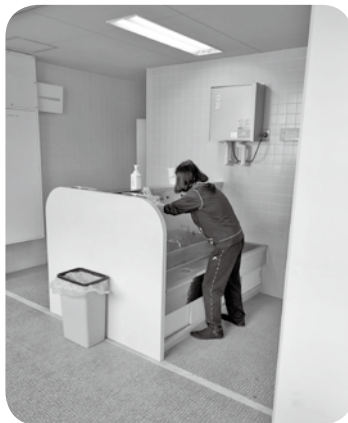
意外と多い洗面台…