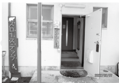
* メンバーさん手作りの看板がお出迎え