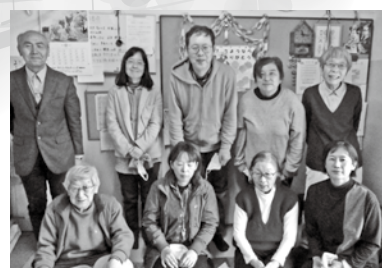
* 閉所式当日、集まった皆さんで