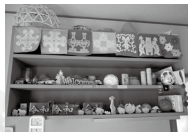
* 館内はメンバーさん手作りの作品が所狭しと展示