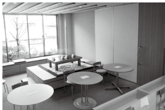
<カフェコーナーイメージ>

活動：軽作業・ワークス上駒&ホールでのカフェコーナー の運営・法人内自動販売機の管理・相談・面接