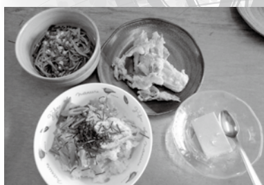
* 皆で色々なメニュー作って食べました