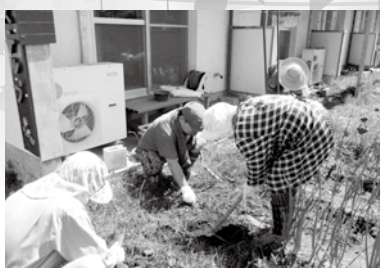
* 暑い日も畑の草取りや地域活動で側溝清掃行いました