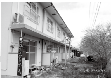
* 毎春、桜が満開！ここまで大きな木に成長しました